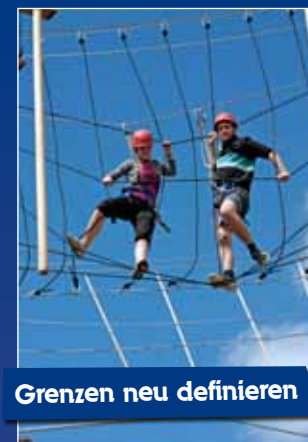
Grenzen neu definieren