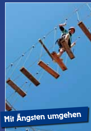
Mit Ängsten umgehen