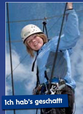
Ich hab's geschafft